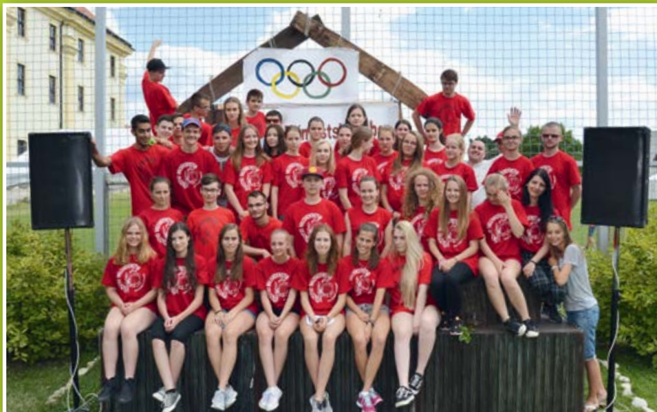
Animátori - letný prímestský tábor 2016